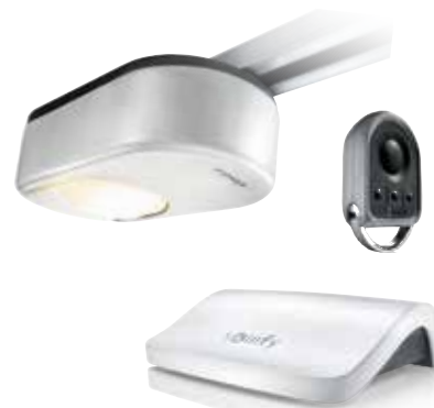
Somfy Dexxo io