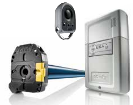
Somfy Antrieb und Rollixo io