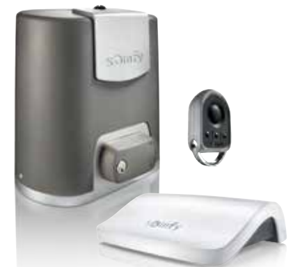
Somfy Elixo io