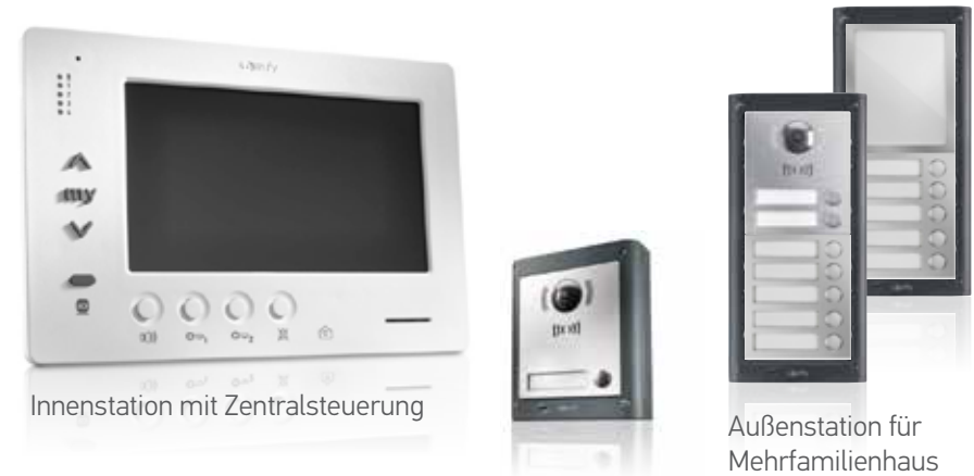
Innenstation mit Zentralsteuerung