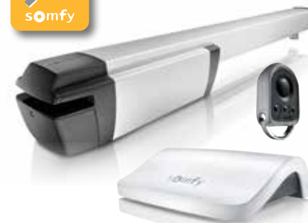
Somfy Ixengo L io